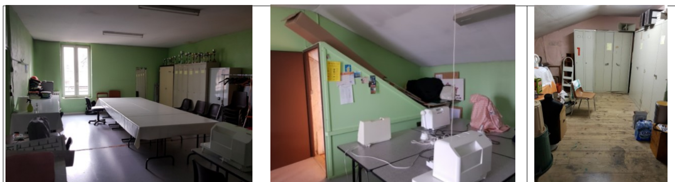
Locaux actuels avant travaux (salle de réunion et bureaux)

Le projet concerne la mise à disposition par bail emphytéotique (sur une durée de 99 années) d'une partie de l'actuelle mairie de la commune de Champenoux. Il s'agit de 98 m 2 de surface de bureaux (bureau salle de réunion au 2 e étage), contiguë au bâtiment de la communauté de communes de Seille & Grand Couronné. Des travaux vont être entrepris par la CC, consistant en l'adjonction de bureaux supplémentaires en lieu et place d'une annexe de la mairie au-dessus de la salle St-Barthélémy, avec création d'une ouverture directe entre les deux bâtiments. Le montant total des travaux est estimé à 359 000 € HT, hors options et ascenseurs et appareils élévateurs.