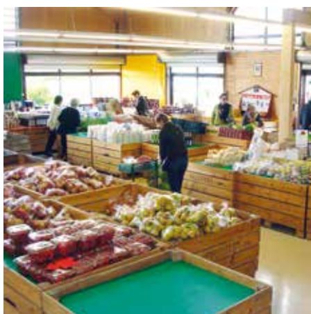
▲ La Croix du Jard