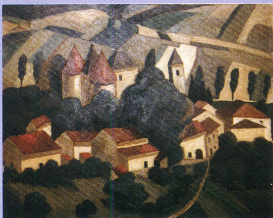
Géo Condé, Le château de Morey , vers 1920

Le sentier redescend vers Belleau par un chemin de terre, puis par une route goudronnée.