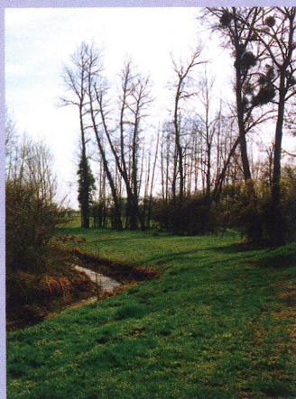
le canal du moulin ; au fond à droite, l'entrée du site de la fontaine St-Gengoult