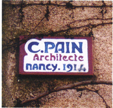
macaron de céramique, signature de César Pain (maison place des Hortensias)

Lanfroicourt a été dévasté pendant la 1 ère Guerre mondiale : sur les 70 immeubles d'avant 1914, 65 ont été complètement détruits. César Pain (1872-1946) est choisi pour conduire la reconstruction du village. Il applique les principes architecturaux dominants de l'époque, qui associent le courant régionaliste et les théories hygiénistes.