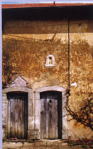
maison ancienne de Bey-sur-Seille