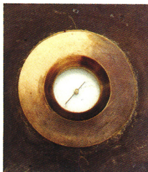
la boussole (détail)

Avec le soutien du Ministère de la culture et de la communication, du Conseil Général de Meurthe-et-Moselle et du Conseil Régional de Lorraine.