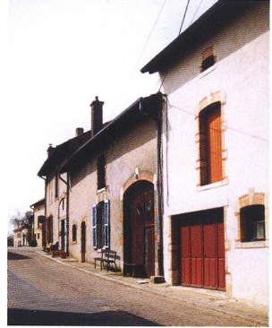
la rue des Géraniums

L'espace public est transformé. La rue est réservée à la circulation : on n'y entropose plus le fumier. Les façades des maisons sont alignées pour créer des rues plus larges et rectilignes, sans décrochement. Le village a un centre qui regroupe les bâtiments publics et religieux (mairie, école, église).